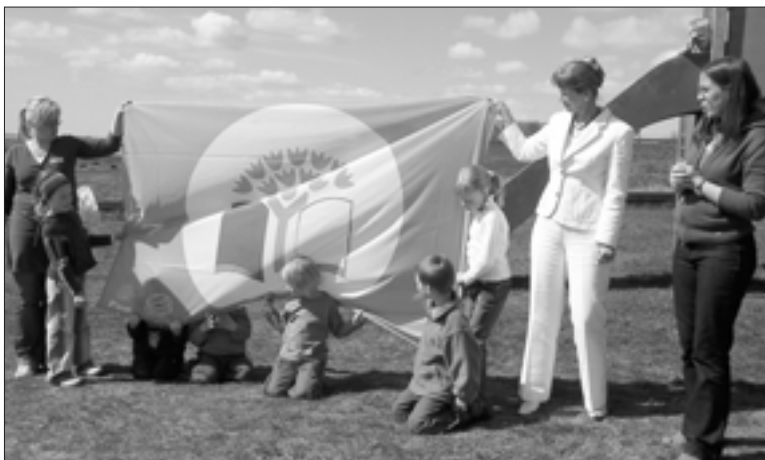
Sigríður Anna Þórðardóttir, umhverfisráðherra færir börnunum í leikskólanum Andabæ á Hvanneyri Grænfánann.

Nú eru 67 skólar í verkefninu Skólar á grænni grein. Leikskólarnir eru 23, eða næstum 10. hver leikskóli landsins, og grunnskólarnir 42, eða næstum fjórðungur grunnskóla. Í verkefninu er einnig einn framhaldsskóli, Fjölbautaskólinn við Ármúla, og einn háskóli, Landbúnaðarháskóli Íslands á Hvanneyri. Af þessum skólum hafa 26 fengið fána og útlit er fyrir að 8 skólar bætist við áður en skólaárinu lýkur í vor. Hver skóli sem er þátttakandi greiðir 60 kr. fyrir hvern nemanda á ári.