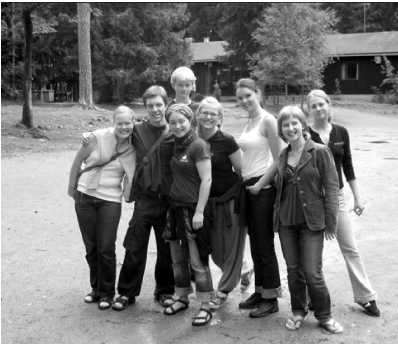
Glaður hópur norrænna ungmenna í sumarþúðum í Finnlandi þar sem þau kynntu sér m.a. umhverfisvernd.

Blaðaúrklippusafn Landverndar, sem nær til tímabilsins 1970 til 1997, var afhent Umhverfisstofnun til vörslu og hefur verið gert aðgengilegt í bókasafni stofnunarinnar.