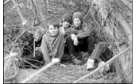
Krakkar að leik í náttúrunni í Alviðru.