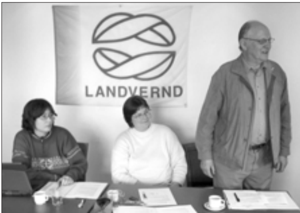
Frá aðalfundi Landverndar 2005.