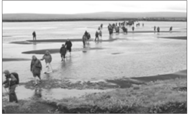
Frá ferð Landverndar og Ferðafélags Íslands í Þjórsárver í ágúst 2005. Hluti hópsins sést fara hér yfir þúfuverskvísl en alls fóru um 230 manns í ferðina.

Borgarstjórn Reykjavíkur samþykkti í janúar s.l. að Reykjavíkurborg, sem eigandi 45% af Landsvirkjun, sætti sig ekki við áform um Norðlingaölduveitu. Jafnframt bærust þau tíðindi að á Alþingi sé meirihluti fyrir því að samþykkja ályktun þar sem mælt yrði fyrir stækkun friðlandsins í Þjórsárverum þannig að það næði betur til þeirra verðmæta sem svæðið býr yfir. Umhverfisráðherra hefur einnig tekið jákvætt undir hugmyndir um að friðlandið verði stækkað og forsætisráðherra segir að Norðlingaölduveita sé ekki aðkallandi verkefni. Forsvarsmenn Skeiða- og Gnúpverjahrepps hafa lýst sig reiðubúna til að ræða stækkun friðlandsins við umhverfisráðherra og Landsvirkjun hefur lagt til hliðar áform um Norðlingaölduveitu.