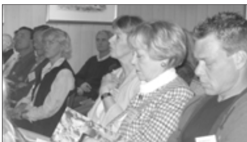
Gestir á ráðstefnu um þjóðgarða, útivist og heilsu hlusta á með athygli á erindi sem flutt voru á ráðstefnunni.