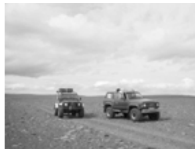
Jeppar á hálendinu.

Á undanförunum aðalfundum Landverndar hefur verið fjallað um vegi á hálendi Íslands. Skiptar skoðanir hafa verið um málið og lýst hefur verið eftir skýrari stefnu samtakanna í þessum málum. Nýlega framkomnar hugmyndir um uppbyggðan háfjallavegi kalla einnig á umfjöllun og stefnumörkun. Til að undirbúa frekari umræður um málið samþykkti stjórn Landverndar að skipa vinnuhóp í þeim tilgangi að taka saman lýsingu á núverandi ástandi, greina stefnu stjórnvalda um vegagerð á hálendinu, taka saman yfirlit yfir ólíkar hugmyndir um hálendisvegi og forsendur þeirra, greina helstu áhrif vegagerða á náttúru- og víðerni hálendisins og gera tillögu að stefnu Landverndar. Hópurinn hefur haldið nokkra fundi og eina opna málstofu. Skýrsla hópsins verður lögð fram á aðalfundi Landverndar 2006.